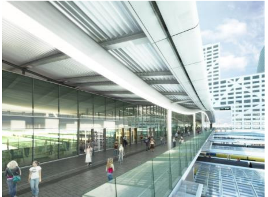
Bouwstap 4 + 5