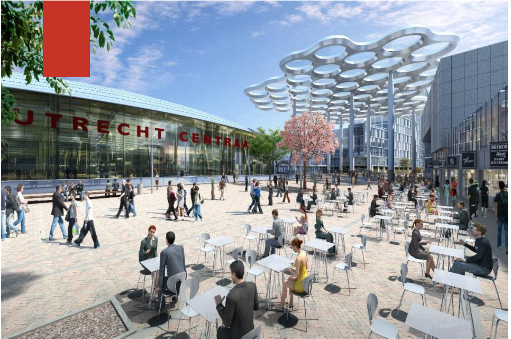
Nieuwe entree Utrecht Centraal - stadskant