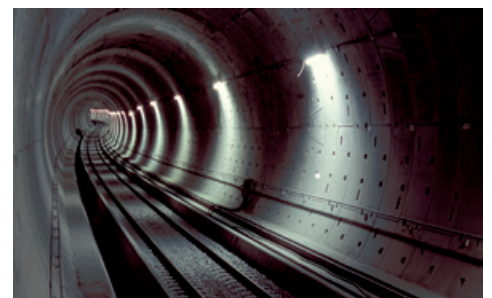
Foto's Rijnlandroute, Ismailia Road Tunnel en de Botlekspoortunnel.

Bent u KIVI-lid, participant van het COB of student dan kunt u zich kosteloos aanmelden. Overige belangstellenden betalen 100 euro.