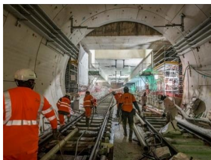
Grand Paris Express