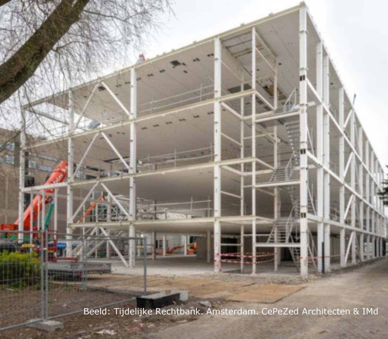
Beeld: Tijdelijke Rechtbank. Amsterdam. CePeZed Architecten & IMd