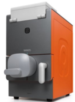
Foto: tafemodel-SEM Nanos